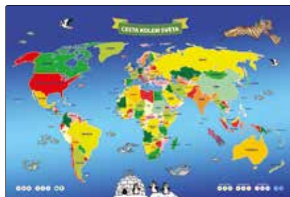
Herní plán a karty s vlajkami států

Předtím než začnete hrát jednu ze tří her, projděte si herní plán a jednotlivé karty států. Dozvíte se spoustu informací, které vám mohou v průběhu jednotlivých her pomoci.