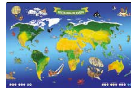
Herní plán a žetony

Vzhledem k možnostem hry můžete kombinovat uvedené hry mezi sebou nebo si vymyslet vlastní pravidla.