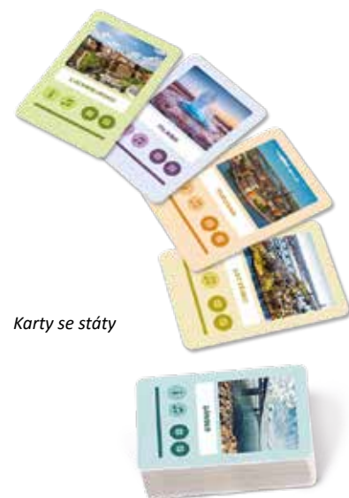
Karty se státy

Domluvte se, na které otázky budete odpovídat. Každá karta obsahuje 2 úrovně obtížnosti otázek. Kostka s jednou tečkou znamená lehčí otázky. Kostka se dvěma tečkami znamená těžší otázky. Můžete se však domluvit i na tom, že mladší hráči budou odpovídat na lehčí otázky a starší hráči na těžší otázky.