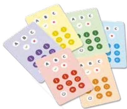
Karty s možnostmi odpovědí

Pokud se žádnému z hráčů nepodaří nasbírat 5 karet do vyčerpání balíčku, vyhrává hráč s nejvyšším počtem karet. Případně se promíchají odložené karty a ve hře se pokračuje, dokud se jednomu z hráčů nepodaří získat 5 karet.